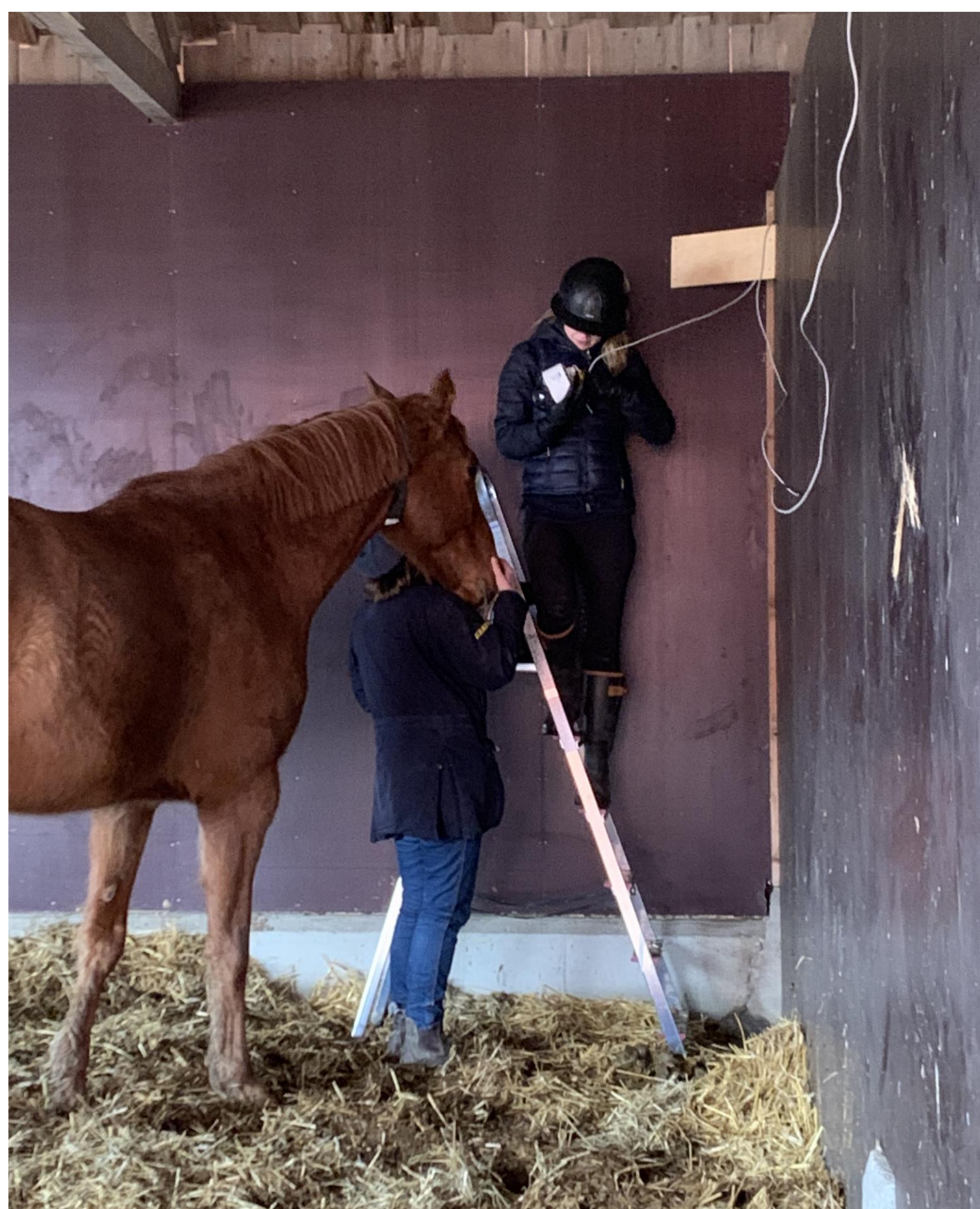
Bild. (privat) Montering av kamera i en utav de tre små ligghallarna under första behandlingen.

Att undersöka och analysera hästarnas preferenser när det gäller utformningen av, och antal ligghallar.