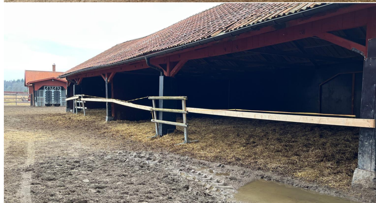
Bilder. Överst visar avspärrning av den stora ligghallen, nederst visar avspärrning av två utav de tre små ligghallarna.